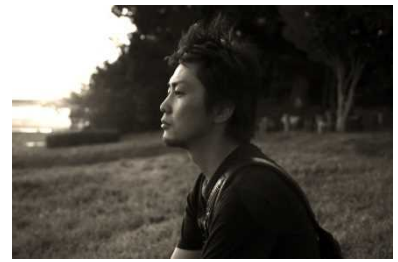
il regista Akihiro Toda

Nato nel 1983, dopo la laurea alla Kindai University e la specializzazione in Arti teatrali, Toda ha lavorato come regista cinematografico e teatrale oltre che in veste di produttore e impresario di spettacoli dal vivo. Il suo debutto nel mondo del cinema avviene nel 2014 con la regia del film Neko ni mikan , cui faranno seguito, tra gli altri, Yokotawaru Kanojo , Kono oto ga kikoeteiruka . Per il teatro ha diretto "The Voice" al Tokyo Metropolitan Theatre. Ha prodotto per il cinema il film Nice to meet you di Takamasa Oe, vincitore dell'Osaka Mayor Award e del Best Actor Award alla VII edizione del CO2 (Cineastes Organization Osaka).